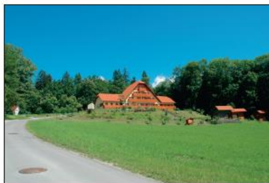
Čebelarški center Slovenije na Brdu pri Lukovici.

Čebelarji so združeni v čebelarški organizaciji, ki obstaja že od leta 1898. Takrat smo ustanovili Slovensko čebelarško društvo za Kranjsko, Stajersko, Koroško in Primorsko s sedežem v Ljubljani. Društvo je začelo izdajati svoje glasilo Slovenski čebelar, ki izhaja še danes. Današnji čebelarji so